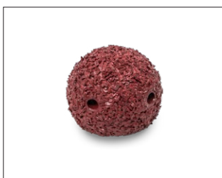
Hartmetall-Halbkugelfräser Einsatzgebiet: Öffnen von Hausanschlüssen und Einläufen

Kardiam-BLACK-POWERLINE® Nicht geeignet für armierten Beton!