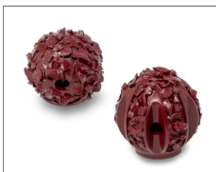
Hartmetall-Kugelfräser Einsatzgebiet: Öffnen von Hausanschlüssen und Einläufen