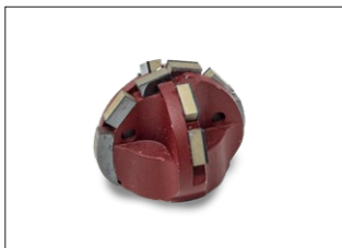
Diamant Halbkugelfräser - kurz - Einsatzgebiet: Öffnen von Hausanschlüssen und Einläufen

Werkzeuge für die Bearbeitung von INLINERN , KUNSTSTOFFROHREN und WURZELN