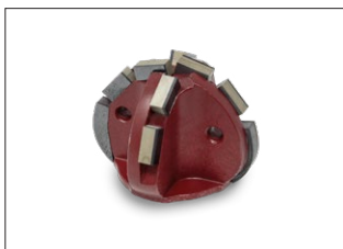
Diamant Halbkugelfräser - lang - Einsatzgebiet: Öffnen von Hausanschlüssen und Einläufen

Kardiam-BLACK-POWERLINE® Nicht geeignet für armierten Beton!